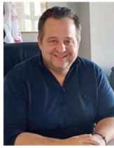
ΓΙΩΡΓΟΣ ΧΑΤΖΗΔΑΚΗΣ Δήμαρχος Ηλιούπολης

Ο «Πολιτιστικός-Αθλητικός Οργανισμός Δήμου Ηλιούπολης (Π.Α.Ο.Δ.ΗΛ.)-Γρηγόρης Γρηγορίου» σας προσκαλεί στις εκδηλώσεις του « Φεστιβάλ Ηλιούπολης 2023 », που θα πραγματοποιηθούν από τις 27 Αυγούστου έως τις 20 Σεπτεμβρίου, στο Δημοτικό Θέατρο Ηλιούπολης «Δ. Κιντής» και ώρα 21:00.